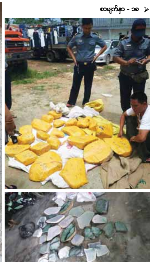
စာမျက်နှာ - ၁၈ >

ပို့ကုန်သွင်းကုန် လုပ်ငန်းရှင်များအနေဖြင့် Sale Contract နှင့် Invoice ပါ ဈေးနှုန်းနှင့်တန်ဖိုးများအား မမှန်မကန်ဖြည့်သွင်းပါက အရေးယူဆောင်ရွက်မည့် လုပ်ထုံးလုပ်နည်းများအား စီးပွားရေးနှင့် ကူးသန်းရောင်းဝယ်ရေးဝန်ကြီးဌာနက ထုတ်ပြန်ကြေညာ